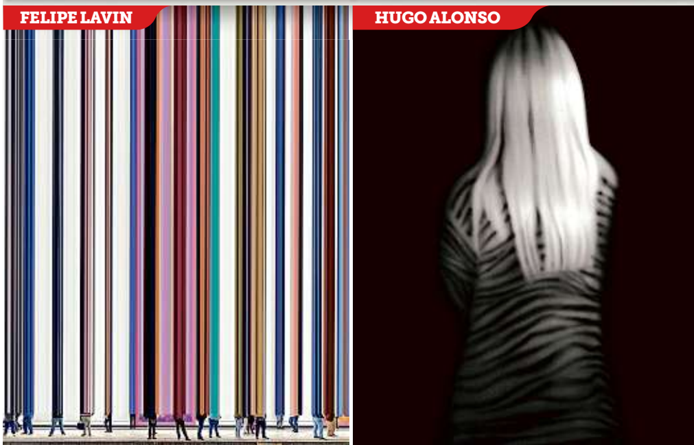
■ Creadores reflexionan, a través del arte, los días actuales, en una suerte de bitácora plástica.

globara a los creadores, pero no iba a significar nada si no teníamos las reflexiones individuales de cada uno de ellos".